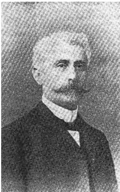
Spiru C. Haret Ultima fotografie.

le-am urmărit, socotind că lucrez pentru binele comun, să fi jignit pe unii, fie în credințele, fie în interesele lor, dar n-am făcut niciodată aceasta pentru satisfacerea nici a intereselor nici a patimilor mele.