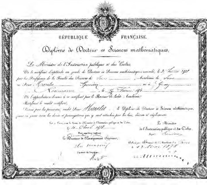
Diploma de Doctor a lui Spiru Haret. 3

Acum începea adevărata muncă pentru scopul ce urmărise plecând din țară: doctoratul. Doctoratul în matematici nu-l obținuse până atunci niciun român la Paris.