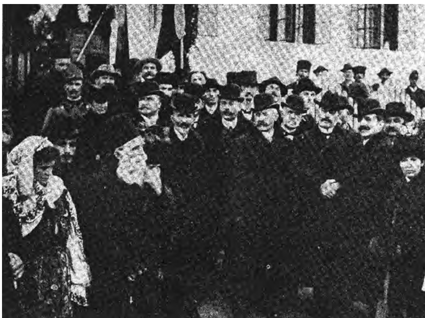
Haret în satul Aref din jud. Argeș la inaugurarea școlii „Dincă Brătianu“, decembrie 1907.

Haret a avut în această epocă o activitate mai complexă. Rolul lui a trecut dincolo de hotarele pe care și le trăsesese altădată. Criticat de adversarii politici, adesea înțeles rău de către unii amici politici, a fost acuzat că voiește să-și facă un partid „haretist“. E adevărat că rolul său devine din zi în zi mai important în politică, fiindcă vedem că, de la 1904, când Sturdza, plecând în concediu, îi