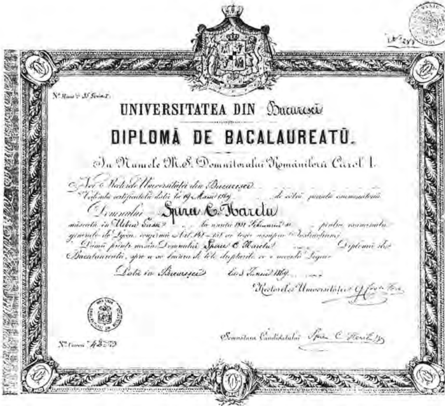
Diplomă de bacalaureat al lui Spiru Haret.