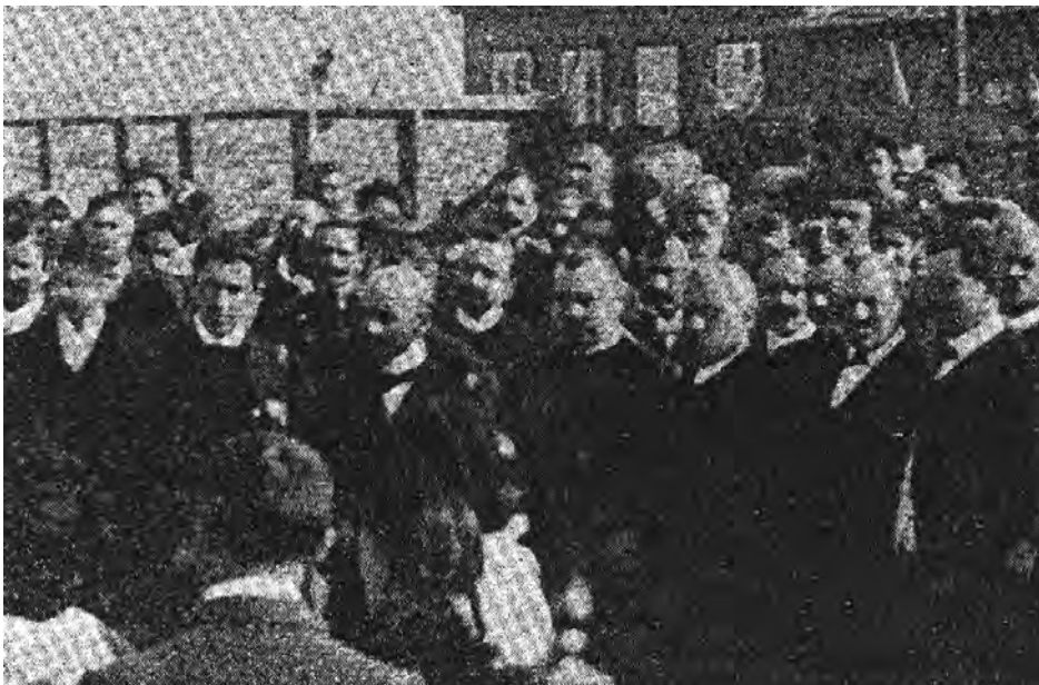
Haret la Sulina la 29 septembrie 1909.

În privința întâmplărilor din 1907, acuzațiile ce i s-au adus atunci au fost de multe feluri. Cei care se considerau „binevoitori“ au zis că răscoalele au fost provocate de învățători, pe care el i-a ajutat în toate felurile și i-a îndemnat să se amestece în activitatea economică a satelor. Intențiunile lui Haret au fost bune, ziceau aceștia, dar n-a cunoscut bine pe învățători, căci ei au voit să devie