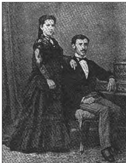
Portretul lui Spiru Haret 8 iunie 1871.

Haret își aducea aminte cu plăcere despre acest început al carierei sale didactice. Povestea, între altele, cum a schimbat numele elevilor săi. Fiind cei mai mulți băieți fii de preoți, ei se numeau Popescu, și Direcția Seminarului, având în fiecare clasă numeroși Popescu Ioan sau Popescu Vasile, hotărâse să-i deosebească prin numere: Popescu Ioan I, Popescu Ioan II, Popescu Ioan III și așa mai departe. Cum clasele seminariilor pe atunci erau foarte încărcate, era foarte greu pentru profesor să-i cunoască (și Haret a socotit totdeauna ca o cerință imperioasă ca profesorul să cunoască bine pe elevi), de aceea întreba pe fiecare de numele comunei de origine și adăuga – pentru cursul lui – pe lângă Popescu IV sau V un Colibași, Moșoaia, Dămăroaia, și altele. Cu timpul, elevii înșiși au văzut că e mult mai bine așa, au adoptat numele dat de Haret și l-au păstrat după ieșirea din școală. După ani și ani se întâmpla să întâlnească Haret pe câte un fost elev din aceștia și să afle că se numește acum cum îl botezase el cu zece sau douăzeci de ani înainte.