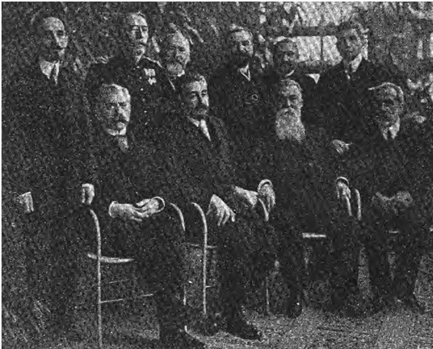
Ministerul liberal care a demisionat la 29 decembrie 1910.

Curând după aceea prăsește și catedra, retrăgându-se la pensie pe ziua de 1 aprilie 1911 2 , după ce servise statului 34 de ani.