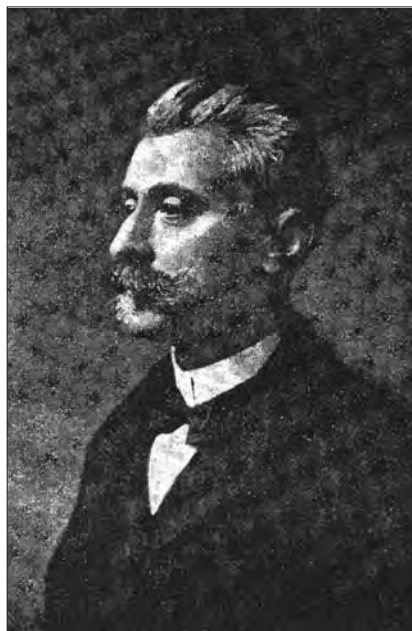
Portretul lui Spiru Haret publicat în Omagiul oferit de foștii săi colaboratori în 1911.

Cea mai importantă acțiune a lui din ultimul an al vieții a fost o încercare mare: înființarea unei ligi pentru „ajutarea muncitorimii ca să se ridice la bună stare și trezirea sufletească cerute de vremea în care trăim“. Dându-i numele de „Liga Deșteptarea“, Haret a publicat un apel în care a arătat scopul asociațiunii și a scos o revistă intitulată „Liga Deșteptarea“.