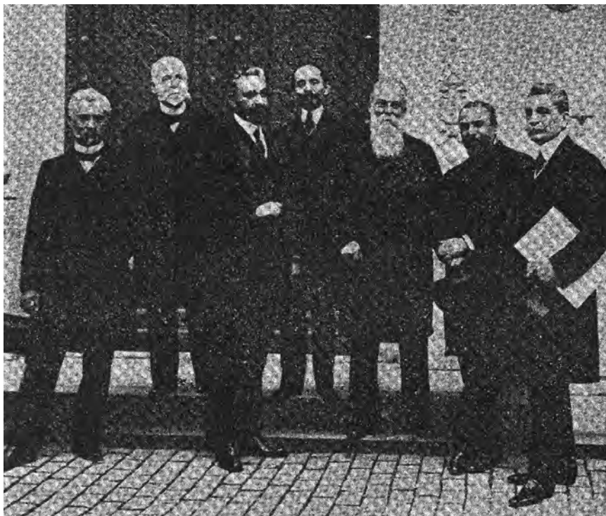
Ministerul liberal de la 4 martie 1909.

Din pricina acestor împrejurări, activitatea lui Haret în ultimul său ministeriat a fost stânjenită de o serie de forțe, unele fățișe, altele ascunse, și a fost târât mereu de pe terenul mai senin al preocupărilor școlare pe acel, plin de agitațiuni, al luptelor politice propriu-zise.