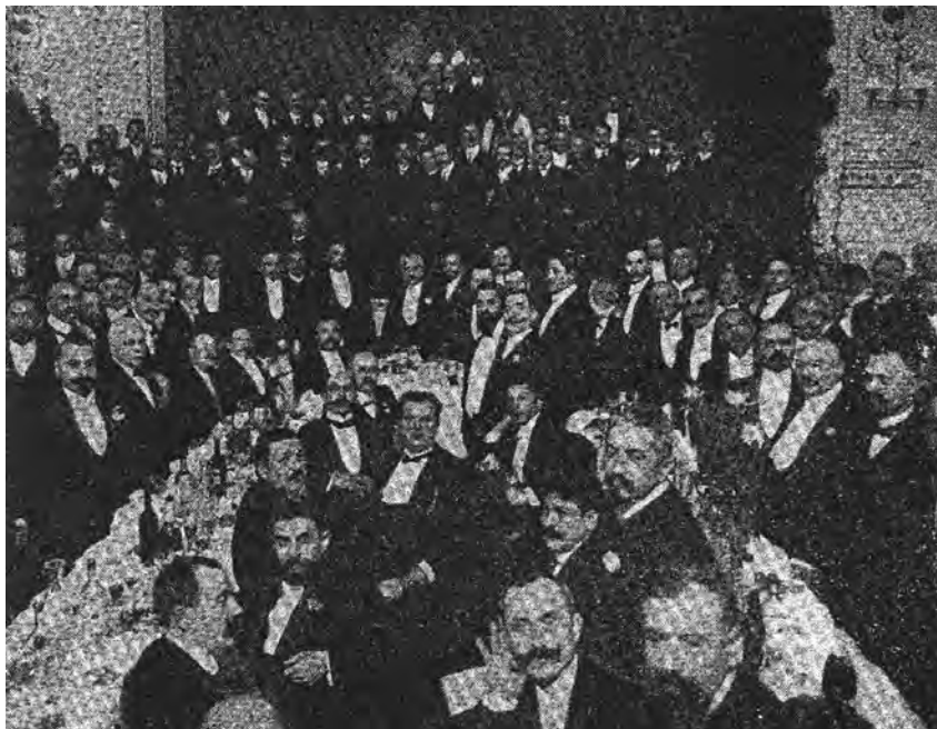
Banchetul de la 12 decembrie 1911.

Continuând preocupările care îl îndemnasă în 1905 să scrie Chestia țărănească , el socotește că măsurile de legiferare luate după evenimentele din 1907, nu sunt suficiente și că problema rămâne tot actuală și destul de acută. „Chestia țărănească formează azi principalul obiect de îngrijire pentru toți aceia pe care îi preocupă soarta viitoare a țării noastre“ zicea el în cuvântarea de la 10 ianuarie 1912, când s-a constituit Liga. Văzând că organizațiile politice nu acordau toată atenția cuvenită, a încercat să dea naștere unui organism care să aibă menirea de a aduce soluțiunile impuse pentru a pregăti un viitor mai bun. Trebuia să se adune într-un mănunchi aceia dintre orășeni, oameni politici și cărturari, care doresc să se apropie de pătura țărănească, și, folosindu-se de toate energiile celor ridicați dintr-însa pe o treaptă de cultură destul de înaltă ca să poată da partea lor de muncă în această operă, cu toții să caute a scoate pe săteni din ignoranță și sărăcie și a forma din ei cetățeni conștienți ai statului. Îndatorirea ce-și impunea această Ligă este „a lucra pentru înfrățirea claselor sociale; nu pornim război contra nimănui, voim să realizăm o faptă patriotică, de înfrățire creștinească și de bună înțelegere“.